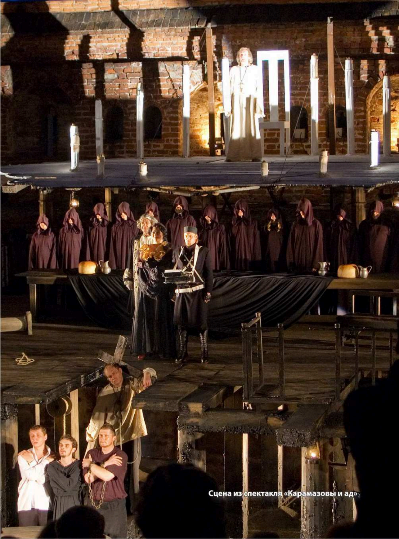
Сцена из спектакля «Карамазовы и ад»